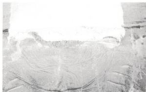
Izquierda, "Pintura 1961" de Antoni Tapies. CARS. Agrietado de la pintura: cola sobre superficie no porosa. La cola forma una película sobre la superficie sin llegar a penetrar. Tiende a secarse por tracción de secado.

terios (monocromos, arte pederedo, forración...). Para su resolución son importantes las opiniones del artista y de otros restauradores, porque el criterio, según los casos, puede oscilar entre la intervención mínima y la más drástica solución.