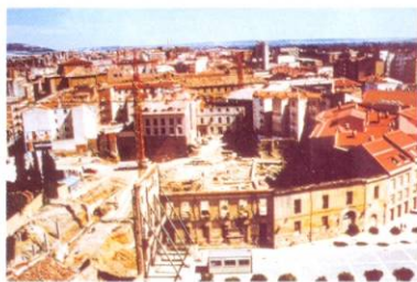
1. Vista general de las excavaciones en la Plaza de la Inmaculada de Palencia

La mayoría de estos restos, especialmente los más grandes, aparecieron con la pintura hacia abajo. Es probable que la argamasa de adobe sobre la que se aplicaron los revocos perdiera su cohesión interna y la suficiente adherencia a la pared de ladrillo o piedra y todo el espesor superficial se desprendiera verticalmente cayendo boca abajo al llegar al