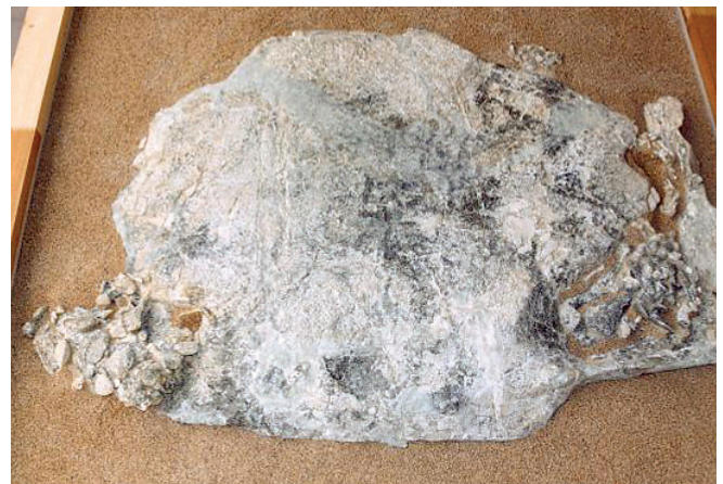
Acabado de la superficie imitando la tierra del yacimiento del fósil Nº2.

Después, para evitar que la espuma entrara en contacto con el hueso, cubrimos el engasado con film de polietileno, y como la catalización de los componentes de la espuma de poliuretano es una reacción exotérmica, para proteger al fósil del calor que se iba a generar, colocamos sobre el polietileno dos capas de papel de aluminio.