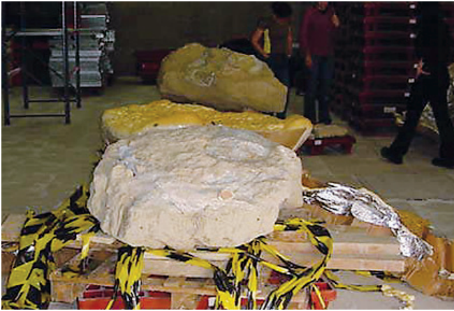
Vista de los diferentes caparazones antes de la eliminación de tierras.