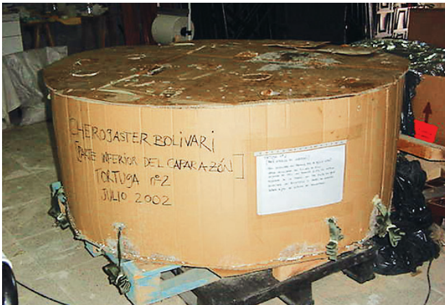
Cama rígida que contenía el caparazón de tortuga.