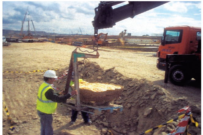
Momento del levantamiento de uno de los caparazones protegido con una cama rígida de poliuretano expandido.

cursos fluviales procedentes del Sistema Central al norte, y de los Montes de Toledo al sur. De esta manera, en las márgenes norte y éste de la cuenca se fueron depositando sedimentos paleógenos (los correspondientes al primer período neozoico) desde el comienzo del Mioceno Inferior (hace 20 m.a.), hasta el comienzo del Mioceno Superior (hace 10 m.a.)