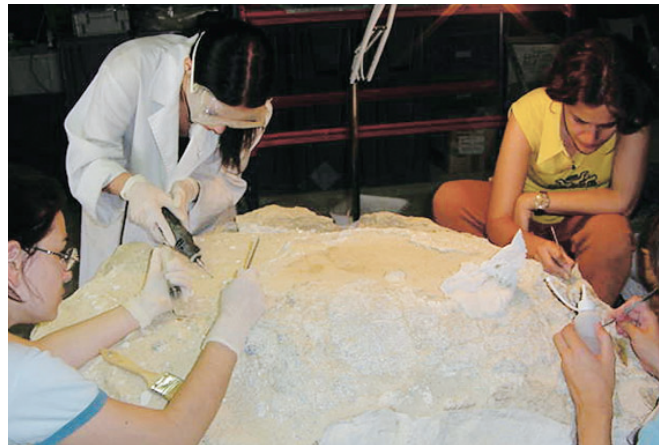
Proceso de limpieza y eliminación de tierras.