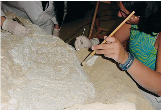
Eliminación mecánica de tierras.