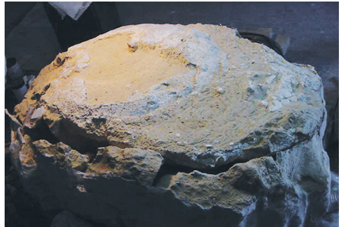
Caparazón con gran laguna en el centro. El resto paleontológico está rodeado de una potente matriz de arenas consolidadas.

laje protector de espuma de poliuretano y cartón, y un tercero, tan voluminoso como los otros dos, junto al cual, sobre sendos tableros de aglomerado, yacían los tres fragmentos que constituían la Tortuga n.º 4.