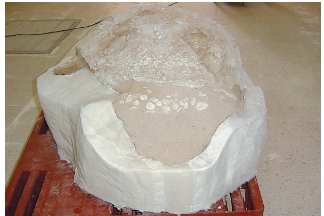
Aspecto final del caparazón de la tortuga nº3.