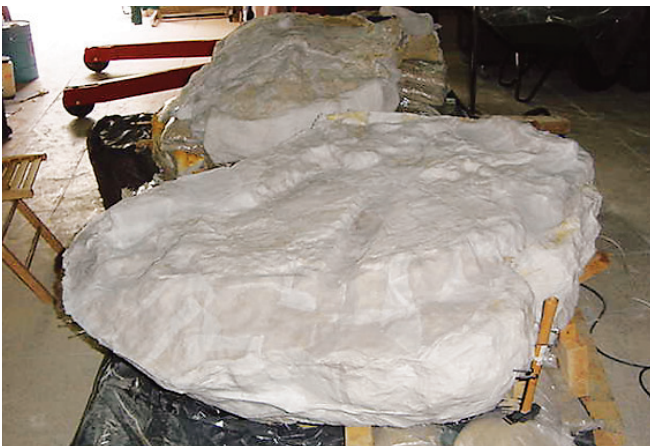
Engasado completo de las piezas antes de realizar una cama rígida.