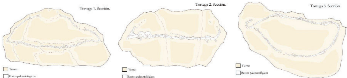
Corte transversal del bloque de tierra y arenas que contienen el caparazón fósil.

Al comienzo de nuestra intervención, lo primero que encontramos al entrar fue un gran bloque de arena de aproximadamente 1,5 cm 3 , con forma ovoide, seguido de un segundo, que aun conservaba su emba-