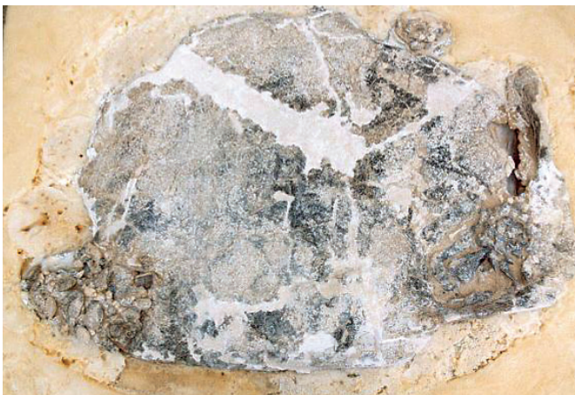
Reintegración fósil Nº2.