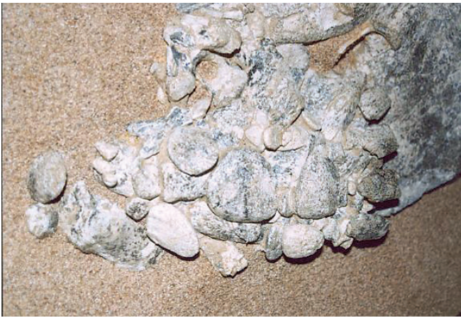
Detalle de una de las patas del fósil Nº2.