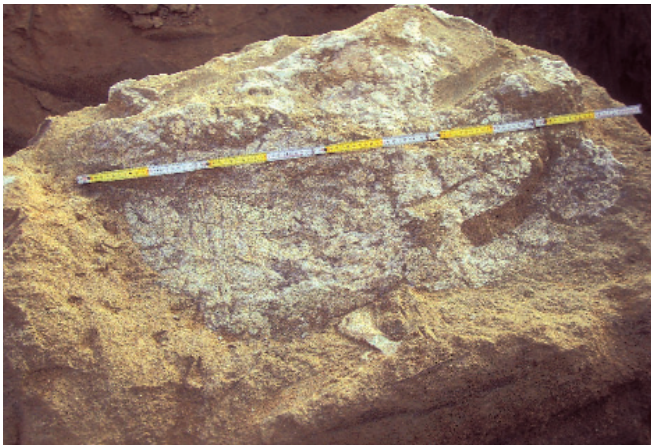
Aspecto de una de las tortugas antes de la extracción.