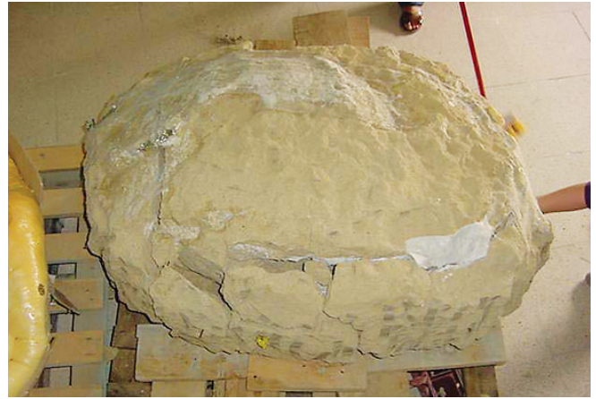
Tortuga nº1 una vez retirado el embalaje.