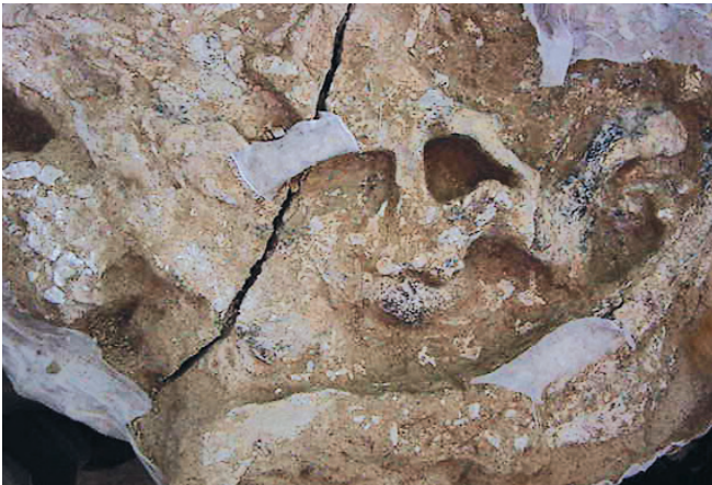
Detalle del conjunto óseo y su estado de conservación.