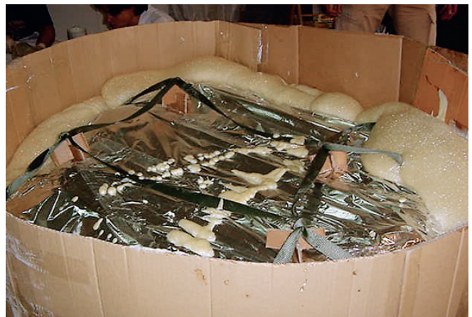
Vertido de poliuretano y cama rígida.

trales del fósil y descubrir el hueso en las zonas donde aún estaba oculto, eliminamos gran parte de la tierra que rodeaba a cada tortuga. Las herramientas más útiles para este fin resultaron ser los taladros y mini taladros, en los lugares donde el grosor de la capa de tierra que protegía los fósiles era considerable, y en las zonas de menor espesor, con una solución de agua y alcohol al 50% atomizamos la superficie, para reducir la cohesión de las tierras y poder arrastrarlas con los bisturíes y escalpelos con menos esfuerzo, y sin generar demasiado barro.