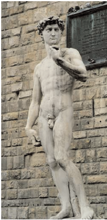
Izquierda: copia de David de Miguel Ángel situada en la Plaza de la Señoría de Florencia, en el lugar que ocupó la escultura original. En Italia: revelaciones de una historia vital. Exposición fotográfica. Alberto Gárate Rivera y Luis Fernando Oviedo. URL: www.mx1.cetys.mx Derecha: Discóbolo de Mirón. Copia romana de un molde reconstruido. URL: thales.cica.es/rd/recursos