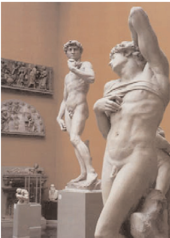
Arriba: la cuadriga de caballos de bronce dorado, primitivamente situados sobre la portada principal de la Basílica de San Marcos en Venecia, ahora se conserva en el Museo de dicho templo.