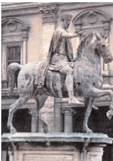
Arriba: estatua equestre de Marco aurelio, de bronce dorado. Se conserva en el interior del Museo Capitolino de Roma.