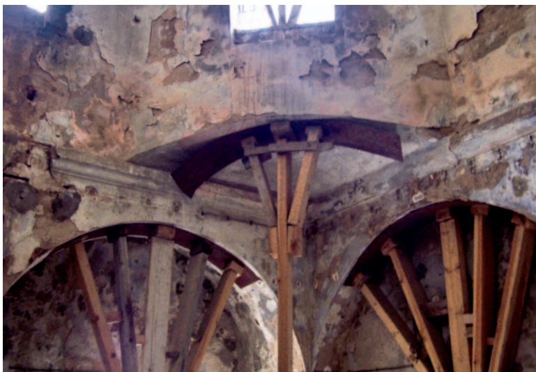
Intervenciones en la estructura de los baños turcos (1708).