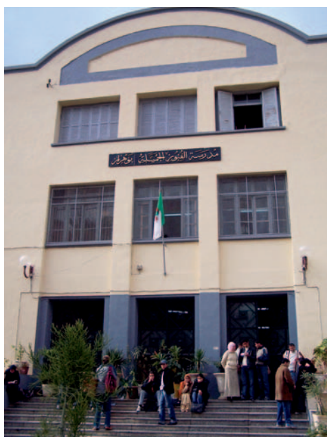
Entrada principal de la Escuela Regional de BB.AA. de Orán.

El curso se divide en 3 trimestres, comenzando en octubre y finalizando en junio, además de tener las prácticas del mes de agosto obligatorias para todos los alumnos. A continuación se muestra un cuadro con las horas totales de teoría y práctica que se imparten durante un año lectivo de 9 meses.