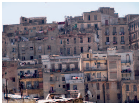
Vista del Barrio de Sidi El Houari (Orán).

Con ello, buscamos involucrar de lleno a los organismos públicos en la necesidad de una buena Gestión del Patrimonio para obtener este fin.