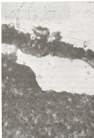
Fig. 1. Julióbriga. Muestra de T.S.H. al microscopio.

Gracias a la siempre inestimable ayuda de la Consejería de Cultura del Gobierno Cántabro y a la dirección de las excavaciones, fue posible crear junto al resto de las dependencias destinadas a siglado, almacenaje, dibujo,